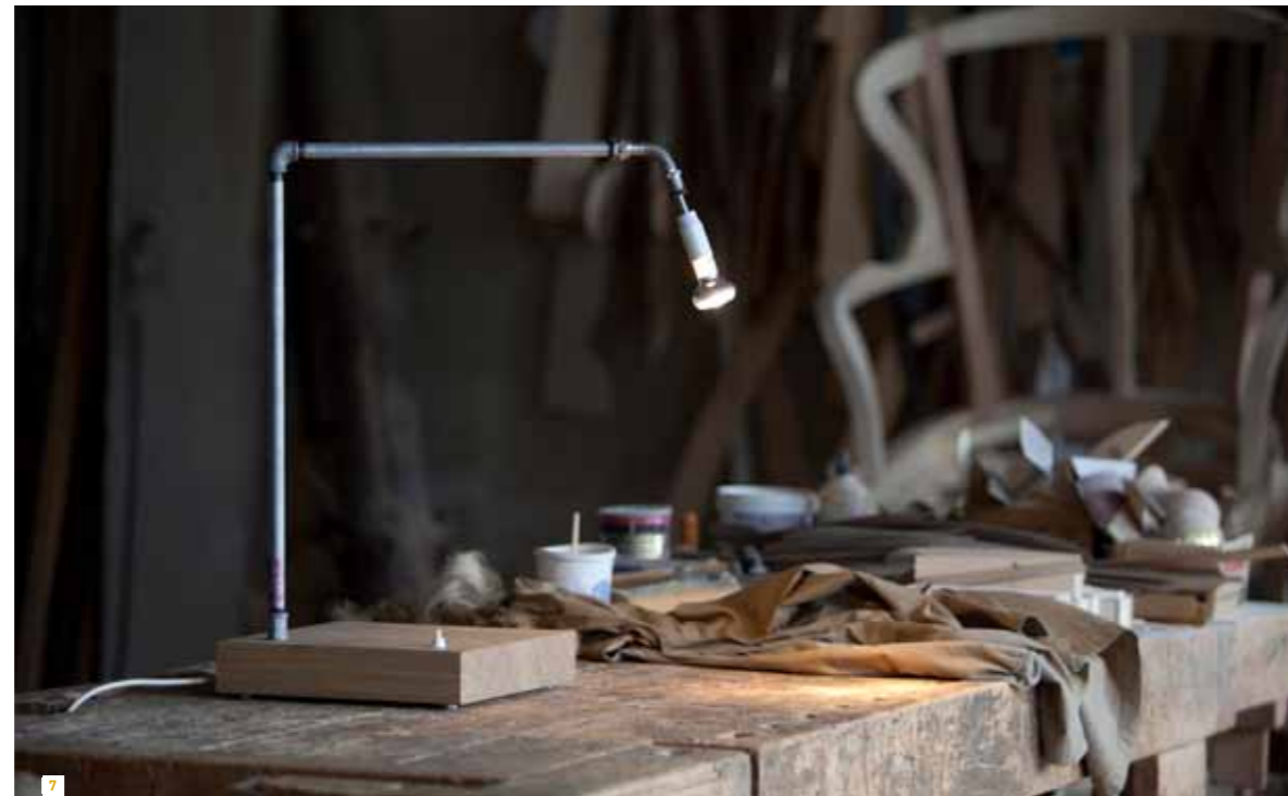
7. Tubularbells di Alessandro Marelli. Tubularbells by Alessandro Marelli.