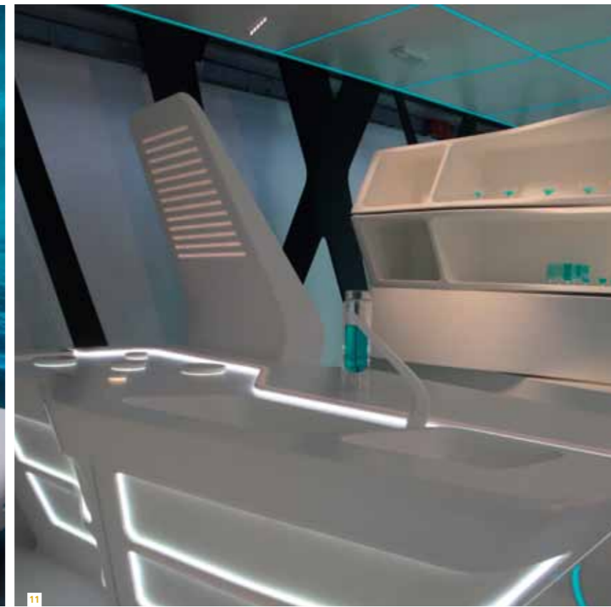
10. Allestimento Tron designs Corianâ®. Arrangement Tron designs Corianâ®.