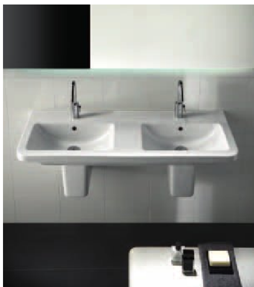
A sinistra, Hatria, Erika Pro . Lavabo con doppio bacino; monoforo in 2 posizioni; da installare sospeso a muro o su mobile. Sotto al centro, Ethos di Galassia , è contraddistinta da un'inconsueta combinazione di forme e materiali che richiamano una raffinata eleganza. A destra, collezione Electra di Tecla nella versione a parete 45x60 cm.