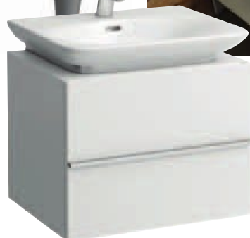
A sinistra, Laufen, Collezione Palace un design senza tempo combinato ad una grande funzionalità. Il designer Andreas Dimitriadis (Platinumdesign) ha rielaborato la filosofia del lavabo classico Palace traducendola in un linguaggio formale più moderno.