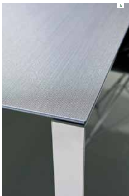
Table by Methis (2011), Laminam 7, mercury WIRE .

complementi e arredi. I nostri interlocutori sono spesso architetti e designers. Da qui la nostra maggiore presenza ad eventi promozionali, workshops, manifestazioni come il Salone del Mobile di Milano, che ci danno l'opportunità di entrare in contatto con un pubblico fatto per lo più di creativi ed offrire il nostro contributo in termini di idee e sviluppo di nuove finiture.